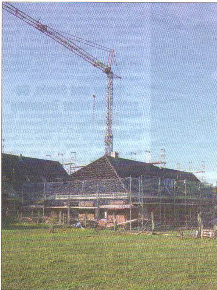
Bereits im Frühjahr 2013 sind die Wohnungen bezugsfertig.